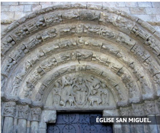
ÉGLISE SAN MIGUEL