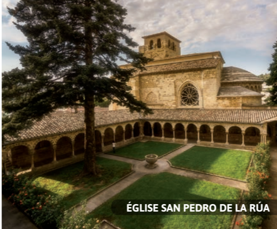
ÉGLISE SAN PEDRO DE LA RÚA