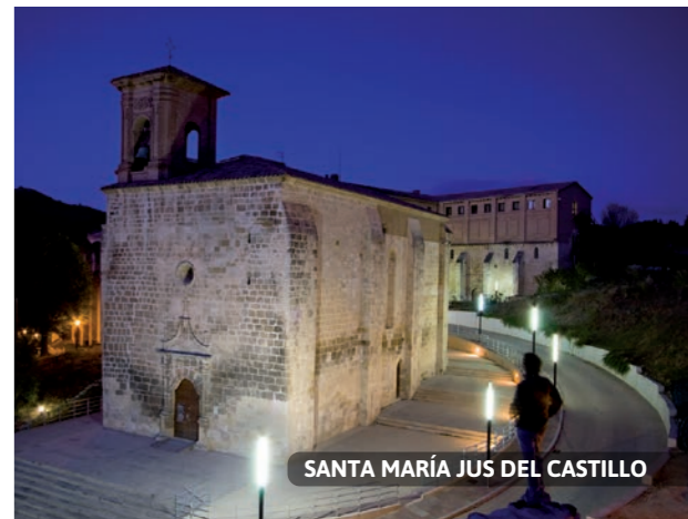
SANTA MARÍA JUS DEL CASTILLO

En façade, l'étage noble est percé de deux balcons flanqués de colonnes à balustres et finissant sur une frise soutenant un tympan incurvé. Si vous avancez le long de la Rúa, vous rencontrerez de nombreux arcs gothiques qui donnaient accès aux boutiques et aux auberges ouvertes sur la rive du chemin de Compostelle.