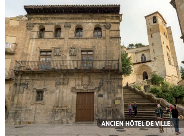
ANCIEN HÔTEL DE VILLE