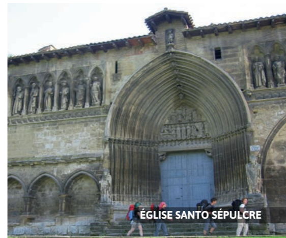
ÉGLISE SANTO SÉPULCRE