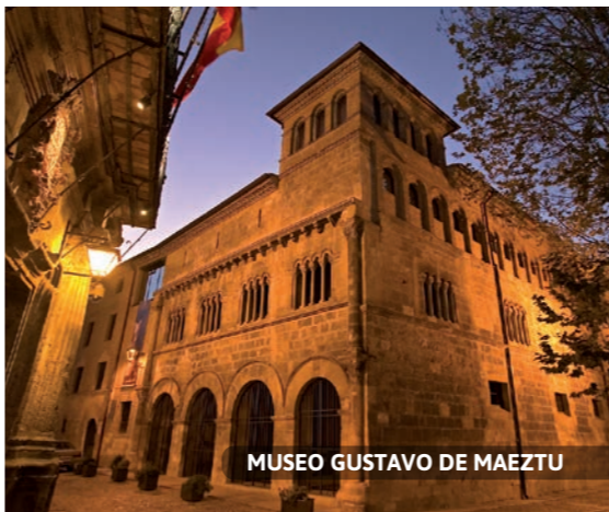
MUSEO GUSTAVO DE MAEZTU