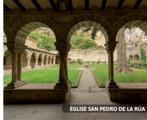
ÉGLISE SAN PEDRO DE LA RÚA