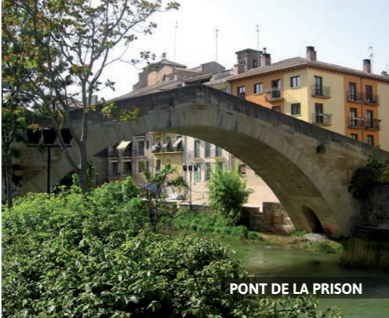
PONT DE LA PRISON

Mais quelle que soit l'époque de l'année, goûtez les succulents poivrons du piquillo ; ils se dégustent farcis de viande ou de poisson, seuls en accompagnement de viandes ou alors en salade comme entrée ; les champignons de à savourer avec des oeufs brouillés ou au four avec de l'ail ; l' agneau au chilindrón (agneau, poivrons rouges, ail et oignon) ; l'« ajorrero » (morue avec une sauce de poivron, oignon, ail et tomate) ou encore les pochas (haricots blancs) en saison (de la fin août à octobre).