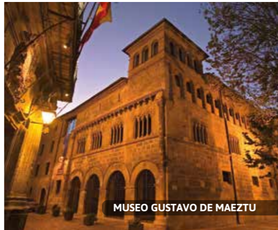
MUSEO GUSTAVO DE MAEZTU