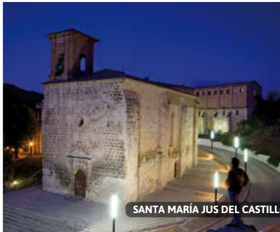
SANTA MARÍA JUS DEL CASTILLO