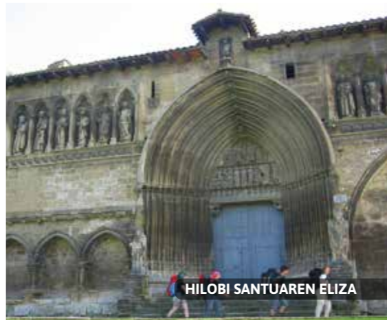
HILOBI SANTUAREN ELIZA