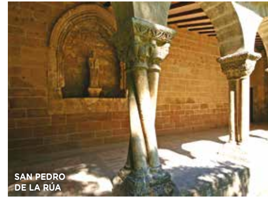
SAN PEDRO DE LA RÚA